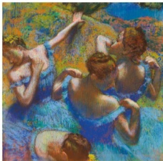
Les Danseuses bleues - 1897 - Edgar Degas (1834/1917) - Musée Pouchkine (Moscou)