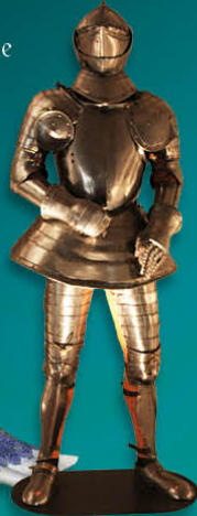
Harnois (Armure du Chevalier)