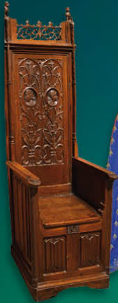
Chaise à haut dossier