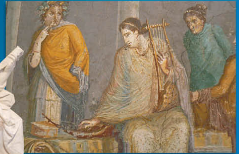
Rome - Harpe sambuca et lyre cithara