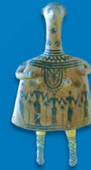
Grèce - "Idole-cloche"