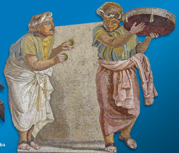
Rome - Joueurs de cymbala et de tympanum