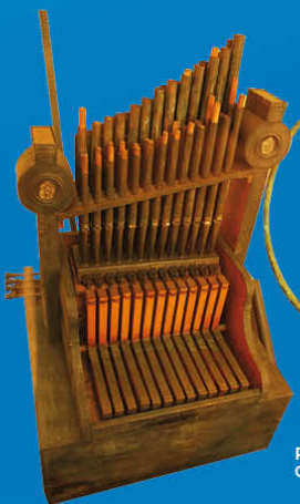
Rome Orgue hydraulique