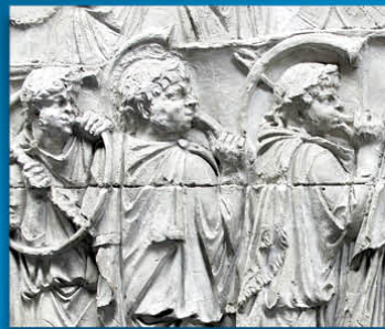
Rome - Joueurs de cornu