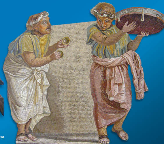
Rome - Joueurs de cymbala et de tympanum