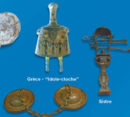
Grèce - "Idole-cloche"