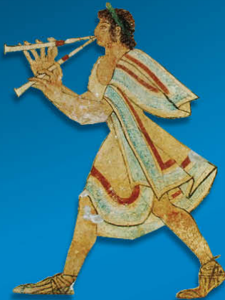
Étrurie - Joueur d'aulos