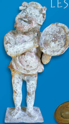
Grèce - Acteur jouant du tympanon