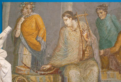
Rome - Harpe sambuca et lyre cithara