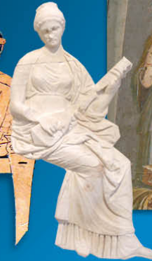
Grèce - Muse jouant de la pandore