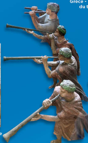
Rome Joueurs d'aulos et de tuba