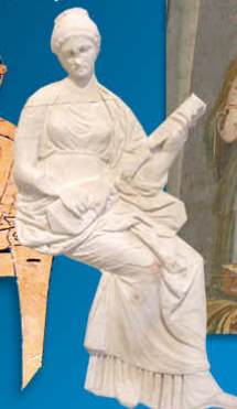
Grèce - Muse jouant de la pandore