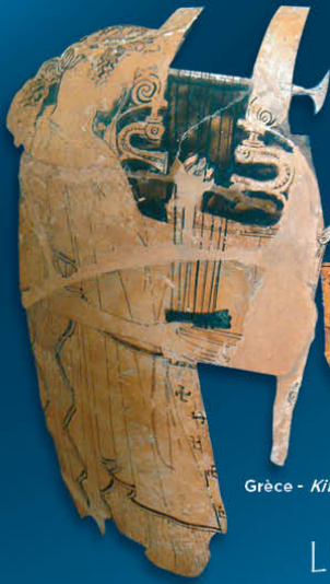
Grèce - Kithara