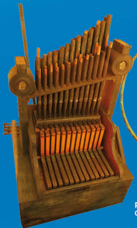
Rome Orgue hydraulique