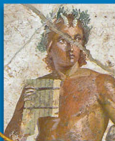
Rome - Le dieu Pan et sa flûte