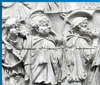
Rome - Joueurs de cornu