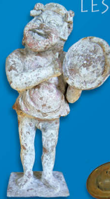
Grèce - Acteur jouant du tympanon