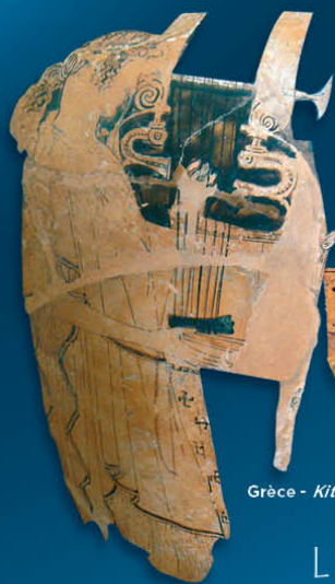
Grèce - Kithara