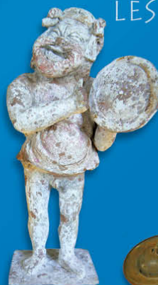
Grèce - Acteur jouant du tympanon