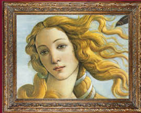
BOTTICELLI La naissance de Vénus