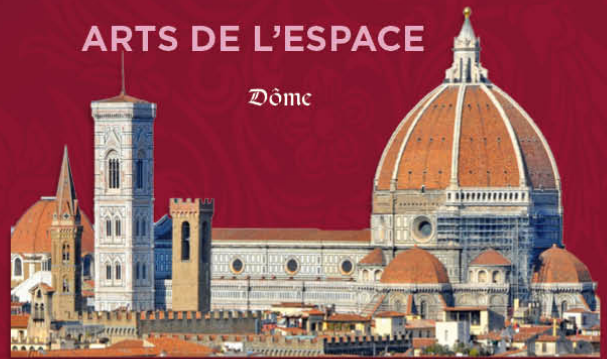
Santa Maria del Fiore (Florence)