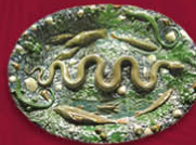
BERNARD PALISSY Céramique émaillée, dite figuline