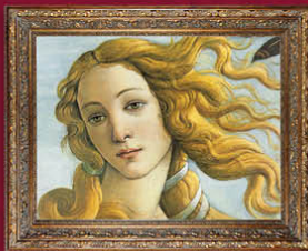
BOTTICELLI La naissance de Vénus