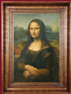
LÉONARD DE VINCI La Joconde