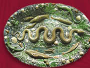
BERNARD PALISSY Céramique émaillée, dite figuline