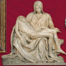
MICHEL ANGE La Pieta