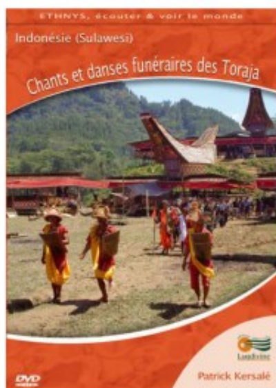
Chants et danses funéraires des Toraja