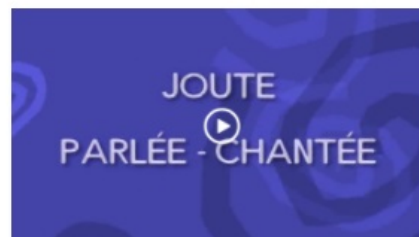
Joute parlée - chantée