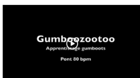
Pont GB 80 bpm