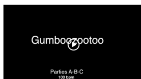
Gumboots - 100 bpm