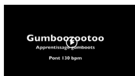
Pont GB 130 bpm