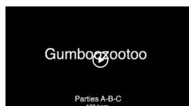
Gumboots - 130 bpm