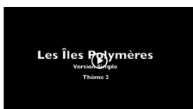
Birbine 2 - simplifiée