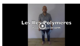
Franges - le pont