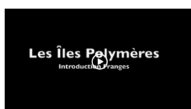
Franges - l'introduction