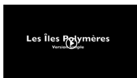
Birbine Thème 1 - simplifiée