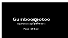
Pont GB 100 bpm