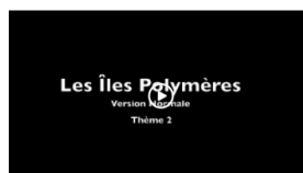
Birbine - Thème 2